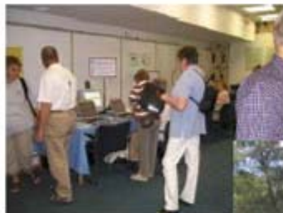
I DIS-lokalen är det samling framför bildskärmarna och utanför på gräsplanen beskådas gamla bilar