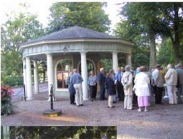
Efter fredagens kurser och konferanser samlades deltagarna för att dricka brunn