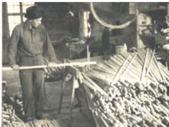
I »Hestra träindustri« tillverkas bl. a. hörärsor, tvättmaskiner, markiser och trädgårdsmöbler av ekgrenar. Det säljs c:a 30,000 räfsor pr år — och det är ett drygt arbete bara att såga skaft till dem.

Turistorten Hestra ligger med sina 3—400 invånare på det småländska höglandet. Luften i Hestra lär vara särskilt hälsosam, och folk som lider av luftrörskatarr eller astma hör till Hestras trogna gäster. Men samhället lever ingalunda bara på turister. Hestra ligger inte för inte i Småland, och under årens lopp har man startat en mängd olika industrier — vars utveckling nu endast förhindras av de ännu svaga elektriska ledningarna. Trots samhällets litenhet är det synnerligen välordnat med en utarbetad stadsplan sedan 20 år. 1911 fanns det sex hus i byn, nu kan man räkna till c:a femtio. Ordnat brandväsen, vatten och avlopp bidrar till att göra livet angenämare. Nyligen besökte SE Hestra och låter här några olika Hestra-bor berätta av sitt dagliga liv.