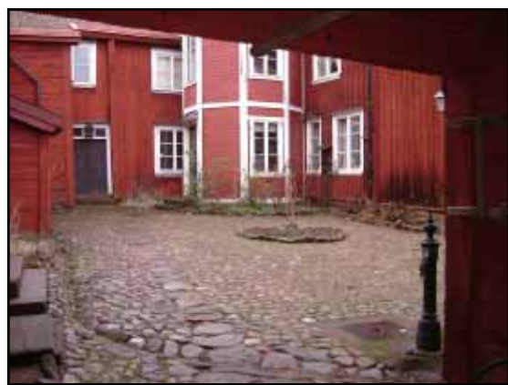
Åschanska gården, Gamla stan, Eksjö.

Den del av staden som ligger norr om kyrkan vid Stora Torget, har sedan dess fått leva sitt liv utan svårare bränder eller andra katastrofer. Detta har bidragit till att i denna stadsdel finns exempel på stor del av Eksjöns 400-åriga byggnadshistoria.