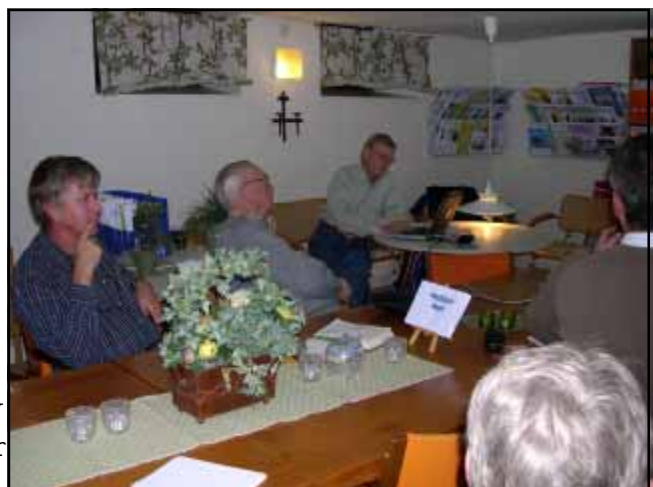
"Gagträff" i Jönköping