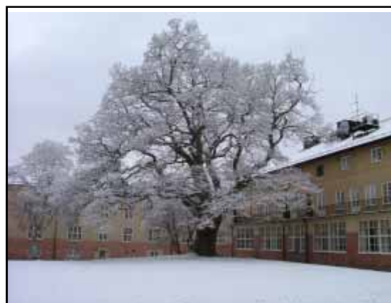
Eken vid f.d. markententeriet I 12

Eksjö blev tidigt en militärstad. Enligt Karl XI:s förordning 1680 skulle de indelta tupporna ha övningsplats "på en slätt och tjänlig plats vid någon skog eller jägar-