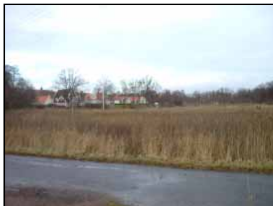
Kanten av Sjöängen. Platsen där Trianon var före flytt till nuvarande plats.