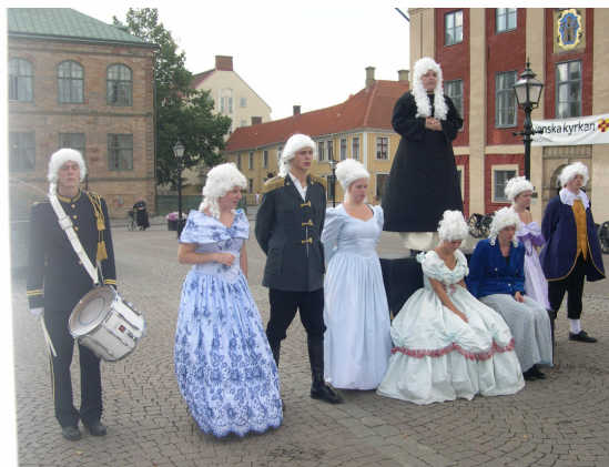
Hela ensemblen från gatuteatern - 2006