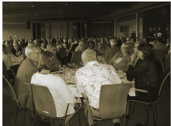
Smålandsbord vid stämmomiddagen

Han avslutade sitt framträdande med att sjunga "Jag är så bra för att vara sant".