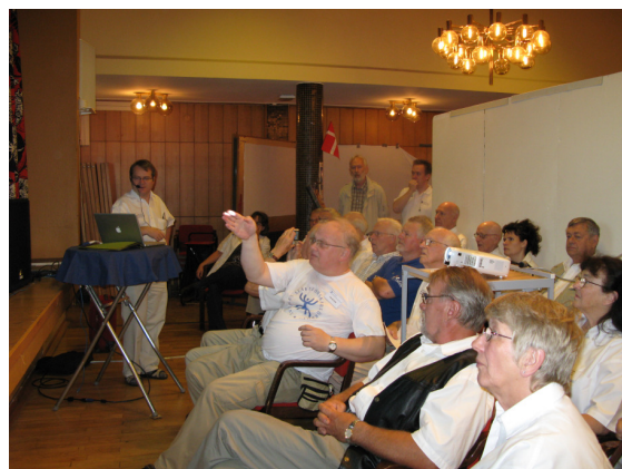
Morgonmöte hos DIS

Efter en lång dag var det skönt att ta en promenad i ett varmt och vackert kvällsljus genom Halmstad.