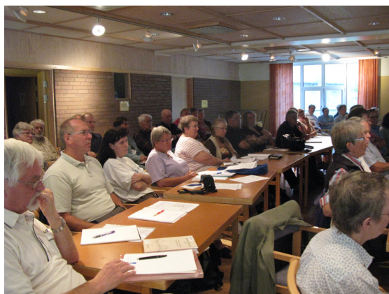
Cirkelledare- och redaktörskonferens

Dessa tre dagar inleds alltid av en konferensdag för dem som har förtroendeuppdrag i de olika förenin garna ute i landet.