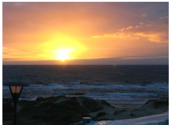
Tack och farväl från Tylösand

För Er som aldrig varit på släktforskar dagar kan jag berätta att detta är ingen nöjesresa utan arbete, gott kamratskap och jätte-mycket släktforskningsprat.