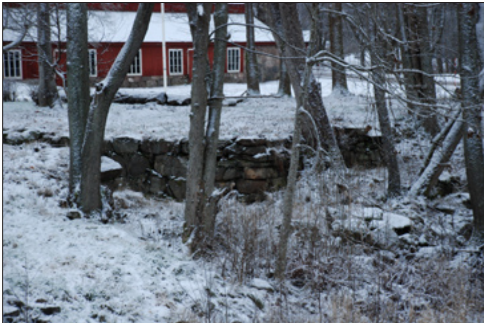
Masugnsgrunden är den enda resten av masugnen som revs på 1880-talet.

I bakgrunden syns den renoverade kolladan.