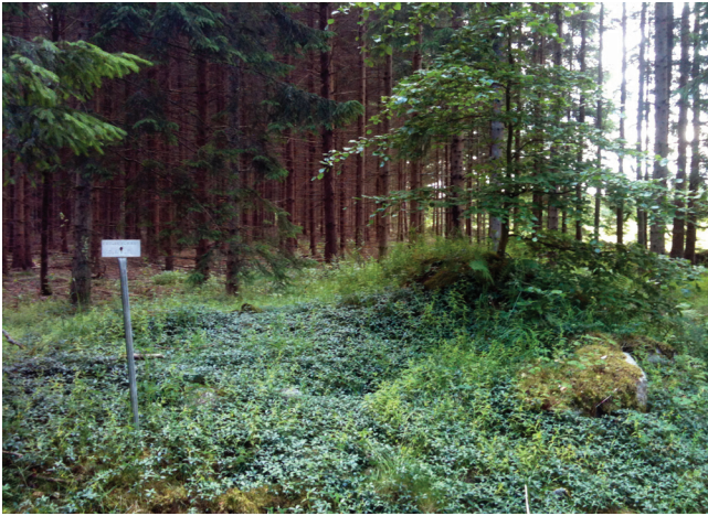
Över torpet Kajsalyckans gamla husgrund och den raserade murstocken växer det nu fullt med vintergröna. Foto 2012.