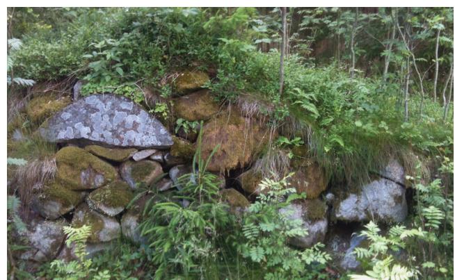
Resterna av Kajsalyckans gamla potatiskällare är det som ligger närmast vägen mellan Östergöl och Östra Toramåla, och som man också ser från väggkanten.

Att förlora sina medborgerliga rättigheter innebar att man inte fick rösta, att man inte kunde få en offentlig anställning och att man inte fick vittna inför rätta. Det var ett straff som talade om för samhället att man inte var att lita på, en förlängning av fängelsestraffet. Detta begrepp kom in i lagtexten i 1864 års strafflag. Tidigare kallades det vanfrejd. Man kunde inte få något frejdebetyg av prästen, vilket försvärade att få arbete. Först 1918 försvann detta begrepp från lagstiftningen.