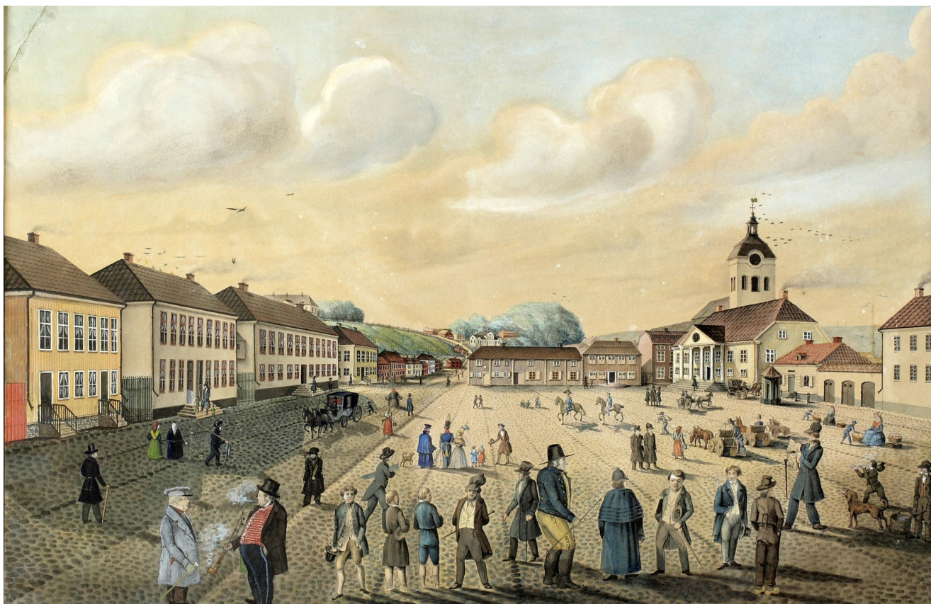
Wexjö torg och Storgata 1837 – året före den stora branden

Konstverk ur Smålands museums samlingar, Växjö Copyright: Kulturparken Småland AB