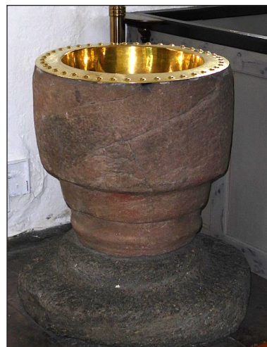
Den medeltida dopfunten i Vittaryds kyrka. Den är i två block med fot av granit och cuppa av sandsten.

Josefine Nilson, Huskvarna - Medlem 4671 josefine-nilson@tele2.se