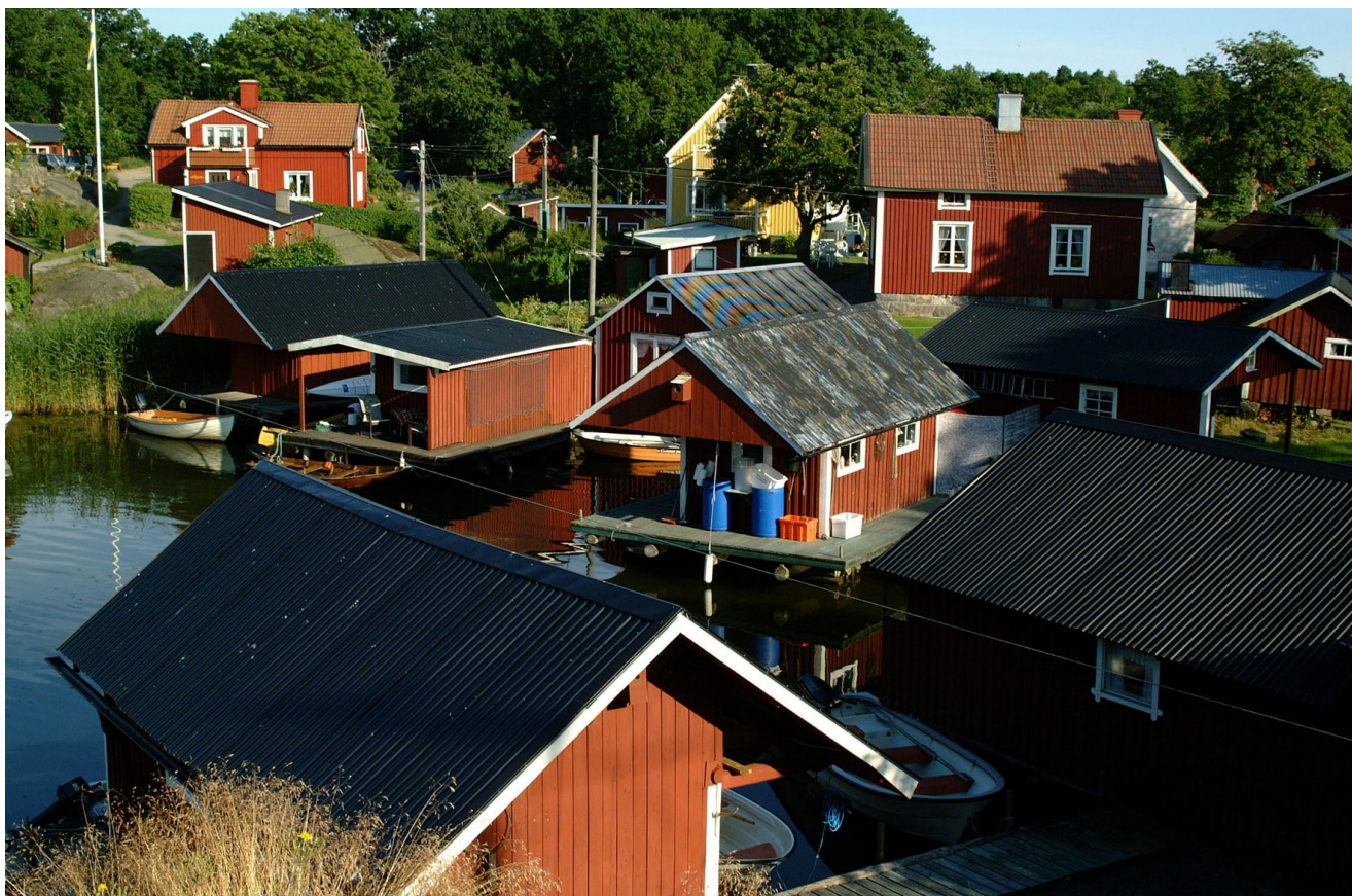
För 200 år sedan drunknade ett föräldrapar från Händelöp och efterlämnade tre små pojkar. 30 år senare drunknade en av de då vuxna sönerna och dennes son.