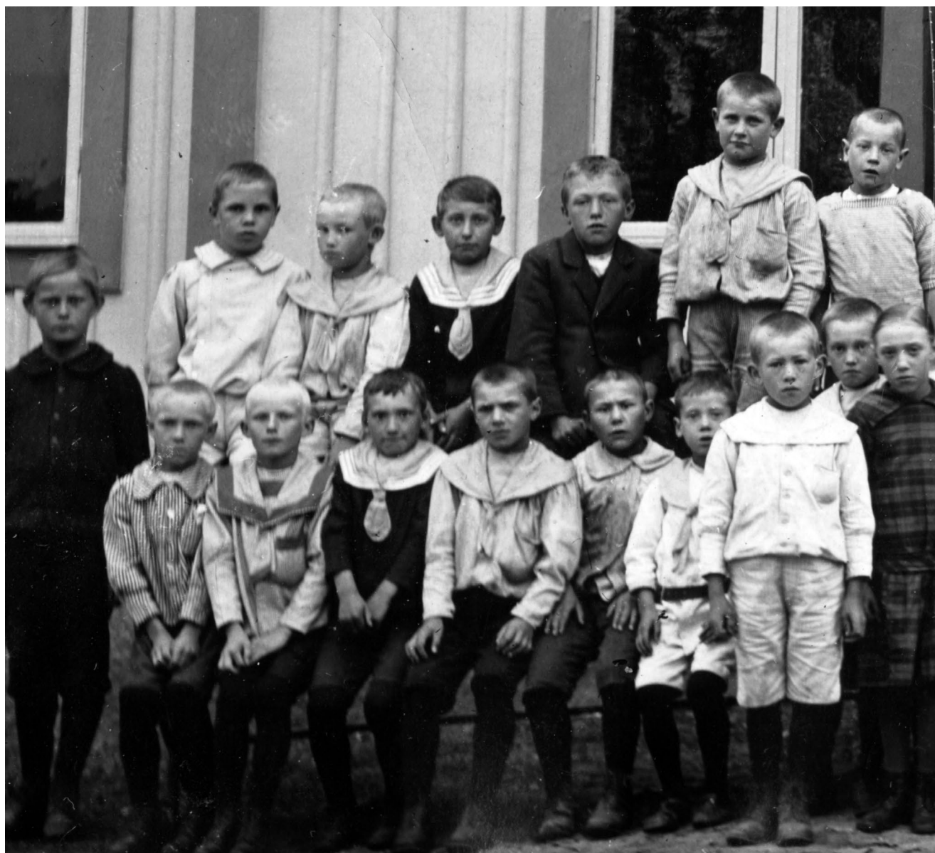
Elever vid Moheda Kyrkskola 1915. Fotot ingår i Moheda skolmuseums samlingar. Redaktören vill i första hand visa hur flickor och pojkar var klädda för hundra år sedan. Om någon känner igen sin far eller mor så är det förstås ett plus. Mittsektionen av fotot, med lärarna och de flesta flickorna, finns på första sidan.