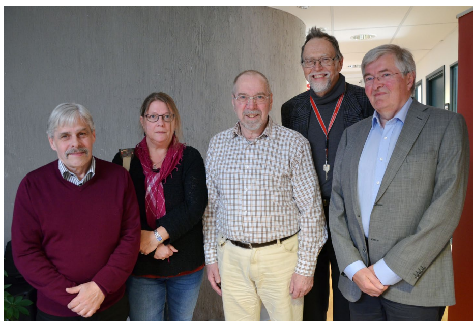
Några styrelsemedlemmar efter årsmötet i Jönköping: