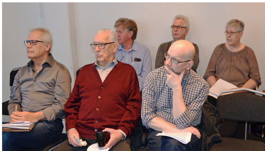
Några deltagare vid DIS-Smålands årsmöte

De här 80 barnen var alltså den totala tillgången i Moheda centralort under en femårsperiod. Jag antar att flera av barnen på fotot därför kom att bilda par så småningom. Därmed uppkommer något som man kan kalla fotoförlust , att ta hänsyn till om man vill beräkna det antal barn och kommande ättlingar de lämnat efter sig. De blir färre för varje parbildning. Kan väl på något sätt jämföras med anförlust , som uppstår vid t ex gifte mellan kusiner.