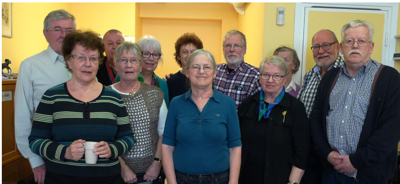
Deltagare vid ett av DIS-Smålands temamöten i Kalmar