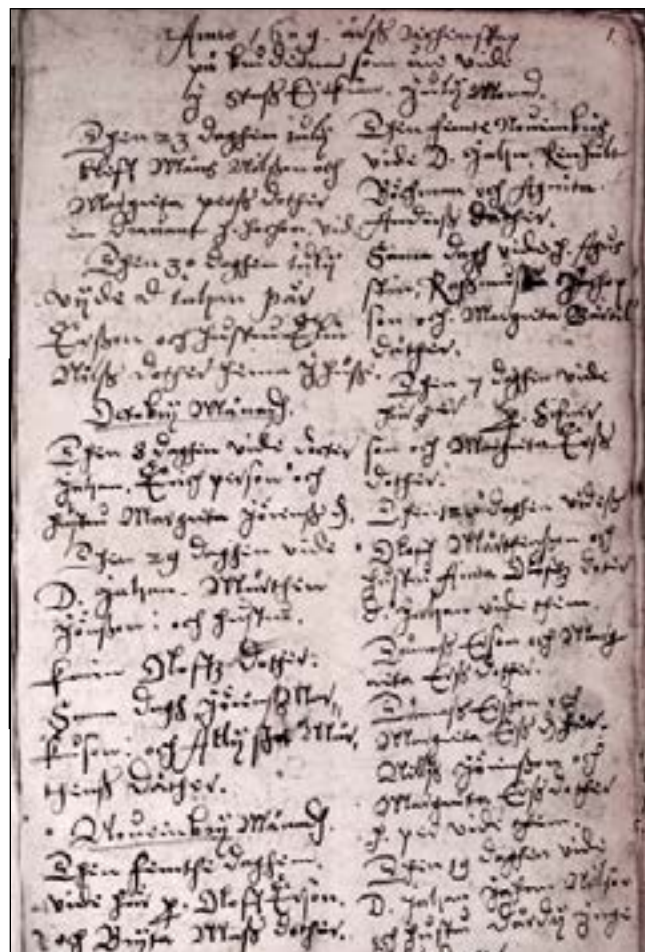
Sveriges äldsta bevarade vigselsbok är från Sankt Nikolai i Stockholm och börjar i juli månad 1609.

Under perioden 1732-1860 togs det även ut en stämpelavgift för själva lysningssedel. Prästen angav ofta i vigselboken hur stor denna avgift var, och det står då oftast Charta vid summan (Charta sigillata). Avgiften räknades ut ifrån hur mycket skatt mannen betalade. En hög stämpelavgift skvallrar därför om en rik make.